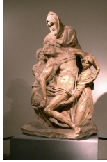
Nicodemus helping to take down Jesus' body from the cross ( Pieta , by Michelangelo ).