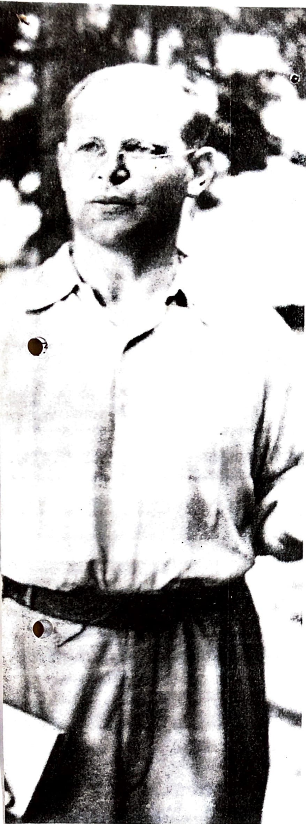
Dietrich Bonhoeffer, zomer 1944, op de binnenplaats van de gevangenis van Tegel. 'De macht van de een heeft de domheid van de ander nodig.'

siteiten van Tübingen, Berlijn en Bonn. In laatstgenoemde stad onderging hij de blijvende invloed van Karl Barth . Na zijn promotie in 1927 werkte de jonge Bonhoeffer een jaar als hulppredikant in Barcelona. Terug in Berlijn gaf hij als privaattoecolleges aan de theologische faculteit. Bij het aan de macht komen van de nazi's in 1933 weigerde hij als een van de zeer weinigen de anti-joodse ariëraparagraaf te ondertekenen. Hij maakte zelf een einde aan een veelbelovende academische carrière.